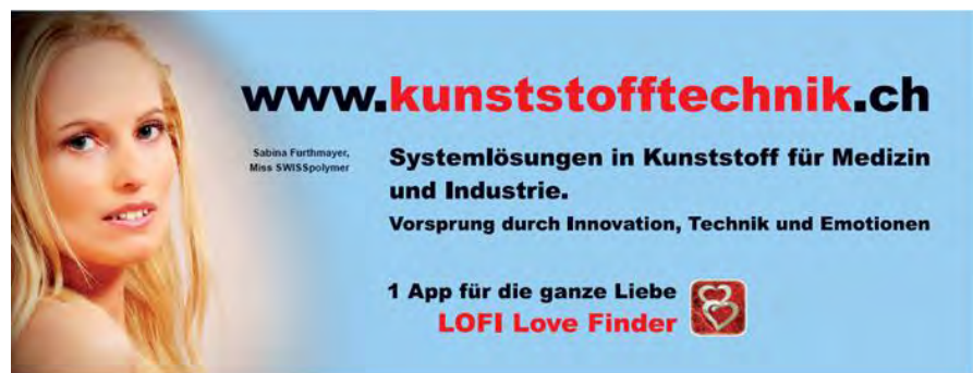
Abb. 8: LOFI – Werbung mit Sabina Furthmayer, Miss SWISSpolymer

Viel Liebe und Erfolg mit dem LOFI Love Finder!