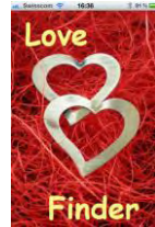
Abb. 1: LOFI Love Finder App für iPhone