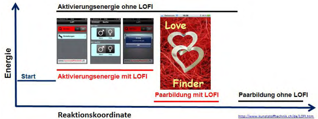
Abb. 5: Katalytische Liebeswirkung des LOFI Love Finder

Mit LOFI wird die Aktivierungsenergie herabgesetzt und die Reaktion beschleunigt