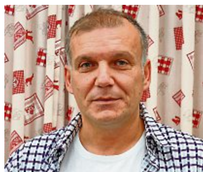
21 Robert Paljuca Preis für Zivilcourage