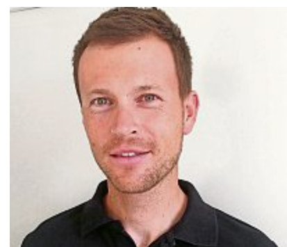
25 Simon Niepmann Olympiasieger im Rudern